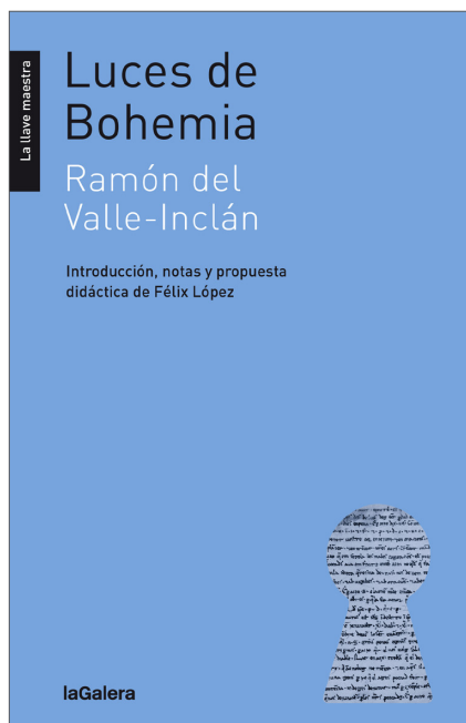
ISBN 978-84-246-6139-7 Disponible: Julio 2017

En 1920 se publicaba Luces de Bohemia y con esta obra Valle-Inclán estrenaba un nuevo género teatral: el esperpento. A través de los ojos del ciego Max Estrella nos llega este retrato grotesco, deformado y absurdo de un Madrid hambriento y opresivo. Una edición pensada para el público escolar con notas, introducción y propuesta didáctica.